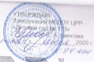
Схема движения транспортных средств, осуществляющих подвоз продуктов по территории МБДОУ ЦРР – «Детский сад № 173»